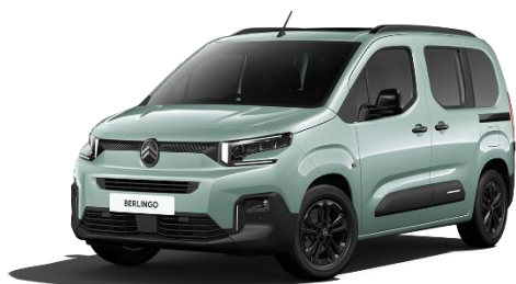
<BERLINGO MAX BlueHDi>

Stellantis ジャパン株式会社（本社：東京都港区、代表取締役社長：成田 仁）は、シトロエンのMPV（Multi-Purpose Vehicle＝マルチ・パーパス・ビークル）であるBERLINGO（ベルランゴ）に、ボディカラー「アクア グリーン」を11月20日（木）より新たに設定し、全国のシトロエン正規ディーラーにて発売します。対象モデルは、標準5人乗りモデルと7人乗りモデルの「BERLINGO MAX BlueHDi」と「BERLINGO LONG MAX BlueHDi」に加え、特別仕様車の5人乗りモデルと7人乗りモデルの「BERLINGO MAX BlueHDi XTR Grip Control Package」と「BERLINGO LONG MAX BlueHDi XTR Grip Control Package」です。