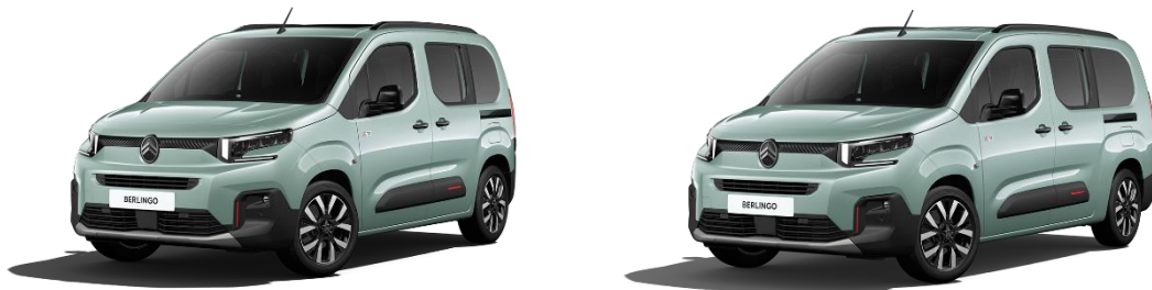
<左 : BERLINGO MAX BlueHDi XTR Grip Control Package> <右 : BERLINGO LONG MAX BlueHDi XTR Grip Control Package>

BERLINGO は、2020 年の日本導入以来、親しみやすいデザイン、充実した収納力、そして優れたシャシーがもたらす安定した走行性能により、ファミリーをはじめ多くの方々に選ばれてきました。昨年 10 月にはフェイスリフトを実施し、最新のブランドロゴバッジと新世代のデザインによる新たな装いで好評を博しています。